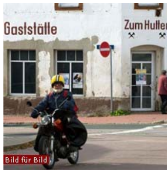
Hoffnung für Brand-Erbisdorf: Die Inder investierten hier

26. November 2010 Auf dem Marktplatz von Brand-Erbisdorf im mittelsächsischen Erzgebirge haben sich die üblichen Verdächtigen versammelt: der Mützenhändler mit seiner grobgestrickten Ware aus harter, kratziger Schafswolle. Die Frau mit den gebrauchten CDs von Peter Alexander bis Stefanie Hertel. Der Wurstverkäufer mit den erzgebirgischen Spezialitäten. Es riecht nach gegrillten Hähnchen und nach dem Kölnischwasser der Marktbesucherinnen, die durchweg älter aussehen als sechzig Jahre. In der Straße hinter dem Platz reiht sich in den Schaufenstern ein „Zu vermieten“-Schild ans nächste. Die Bahnhofskneipe „Zum Hutten“ ist geschlossen und halb verfallen, auf dem Bahnsteig wuchert das Gras. Hier halten schon lange keine Personenzüge mehr.