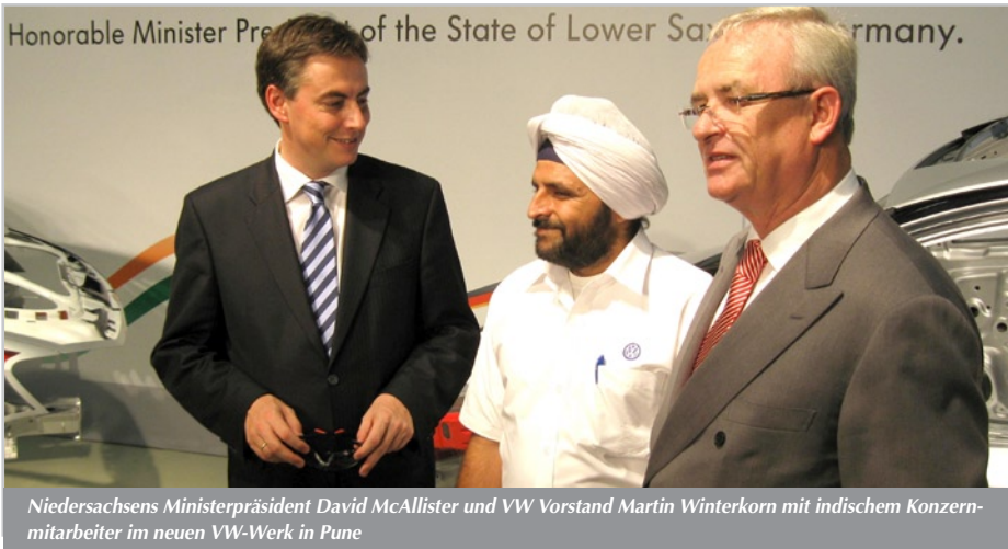
Niedersachsens Ministerpräsident David McAllister und VW Vorstand Martin Winterkorn mit indischem Konzernmitarbeiter im neuen VW-Werk in Pune

Warum finden Delegationsreisen statt? Die Antwort darauf lautet: Um Kontakte zu knüpfen. Nicht so eindeutig ist es, mit wem diese Kontakte geknüpft werden sollen. Jedenfalls entstehen Kontakte unter den Delegationsteilnehmern selbst. Eine Garantie für Kontaktabbahnungen mit Partnern aus dem Zielland der Delegationsreise ist nicht immer sichergestellt und auch oft gar nicht so wichtig. Auf Politikerdelegationsreisen z.B., will man in erster Linie dem reisenden Politiker nahe sein. Und auf so einer Indienreise wird sicherlich nicht nur über Indien gesprochen.