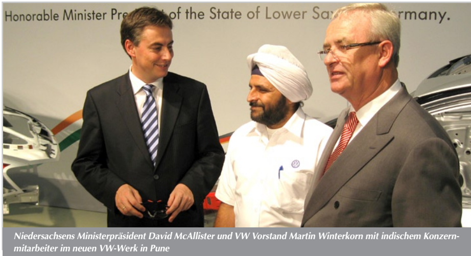
Niedersachsens Ministerpräsident David McAllister und VW Vorstand Martin Winterkorn mit indischem Konzernmitarbeiter im neuen VW-Werk in Pune

Warum finden Delegationsreisen statt? Die Antwort darauf lautet: Um Kontakte zu knüpfen. Nicht so eindeutig ist es, mit wem diese Kontakte geknüpft werden sollen. Jedenfalls entstehen Kontakte unter den Delegationsteilnehmern selbst. Eine Garantie für Kontaktabbahnungen mit Partnern aus dem Zielland der Delegationsreise ist nicht immer sichergestellt und auch oft gar nicht so wichtig. Auf Politikerdelegationsreisen z.B., will man in erster Linie dem reisenden Politiker nahe sein. Und auf so einer Indienreise wird sicherlich nicht nur über Indien gesprochen.