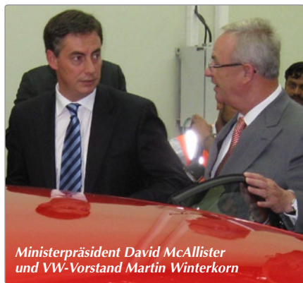
Ministerpräsident David McAllister und VW-Vorstand Martin Winterkorn

„Blau und rot dürften die beliebtesten Farben für unsere Autos hier im farbenfrohen Indien werden,“ mutmaßt VW-Vorstand Martin Winterkorn über die indischen Autobestellungen der Zukunft. Seit März 2009 produziert VW in Pune für den indischen Markt. Rund 2.500 Mitarbeiter stellen hier derzeit 31 Autos pro Stunde her. Volkswagen hat 580 Millionen Euro in Indien investiert und gegenüber den Konkurrenten Maruti Suzuki und Tata auf dem zur Zeit am stärksten wachsenden Pkw-Markt der Welt immer noch erheblichen Nachholbedarf.